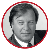
Ревишвили Амиран Шотаевич академик РАН