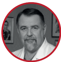
Шевченко Юрий Леонидович академик РАН, почетный председатель Организационного комитета Конференции