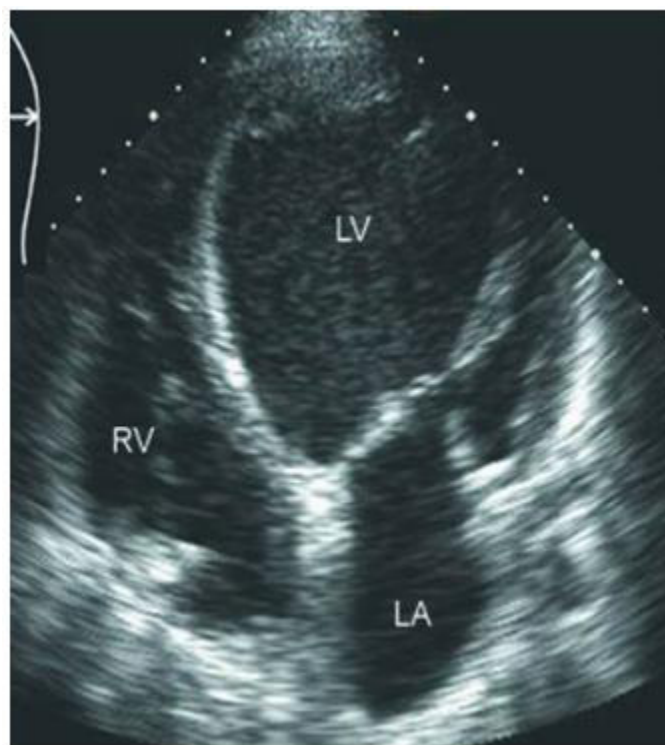
Рис.2. ЭхоКГ пациента Н, 46 лет